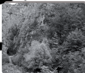
▪ SOBRESCOBIO ▪