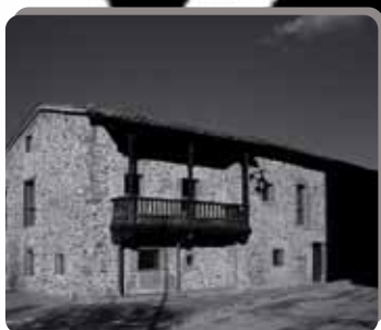
▪ LAVIANA ▪