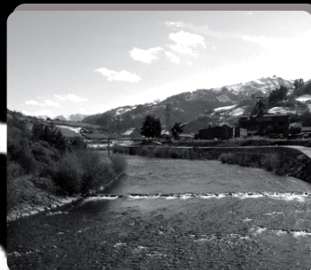
▪ SAN MARTIN DEL REY AURELIO ▪