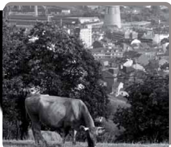
▪ LANGREO ▪